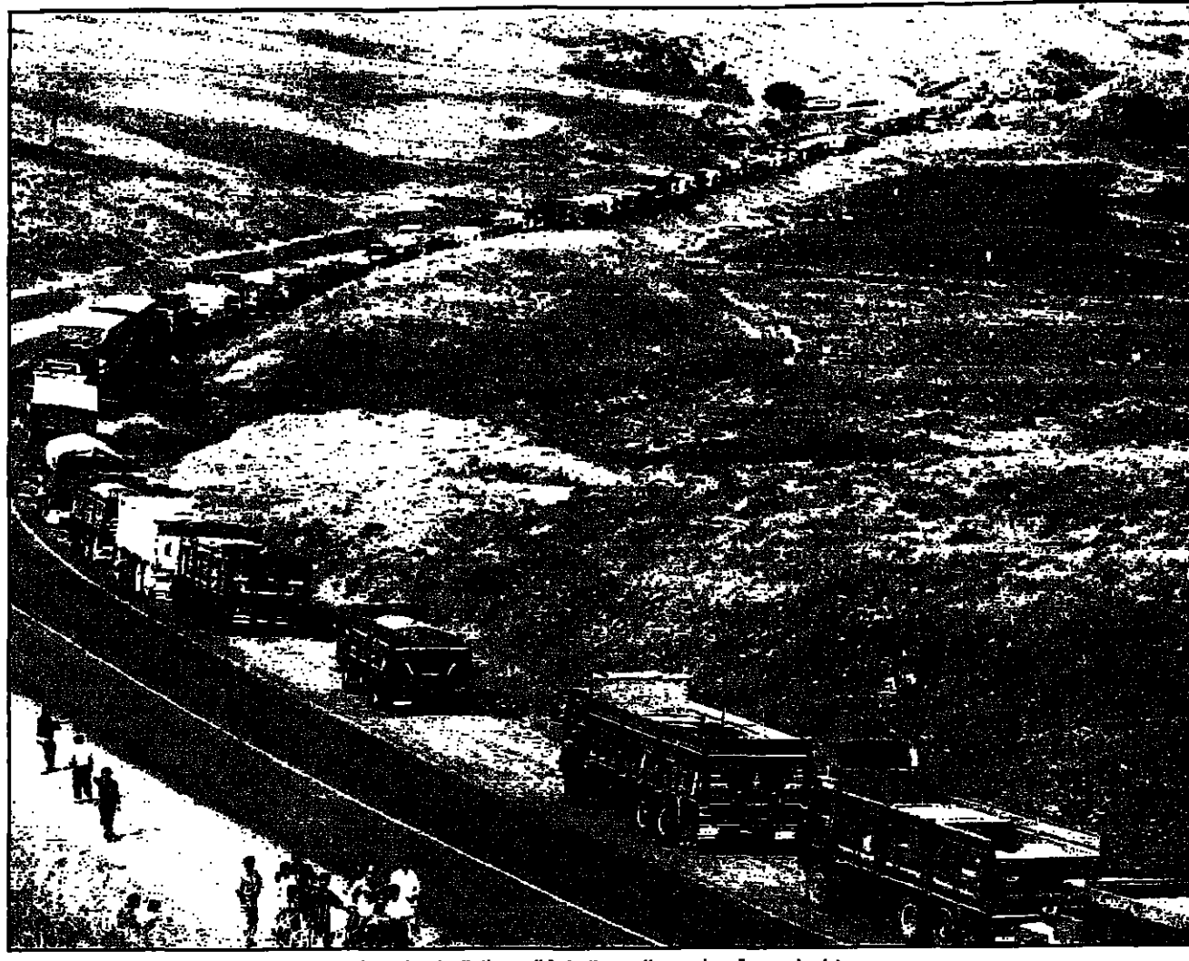
شاحنات ممتلئة تنتظر عبور الحدود التركية الى شمال العراق

بغداد - من حسن حافظه اصب حشك الامم المتحدة في العراق اس من قلقه ازاء توغل تركيا داخل اراضي شمال العراق قائلا ان ذلك قد يهدد تحقيق اتفاق لوقف إطلاق النار بين العراق والولايات المتحدة. وقال حشك في بيان له ان التوغل التركي في شمال العراق قد يهدد تحقيق اتفاق لوقف إطلاق النار بين العراق والولايات المتحدة. وقال حشك في بيان له ان التوغل التركي في شمال العراق قد يهدد تحقيق اتفاق لوقف إطلاق النار بين العراق والولايات المتحدة.